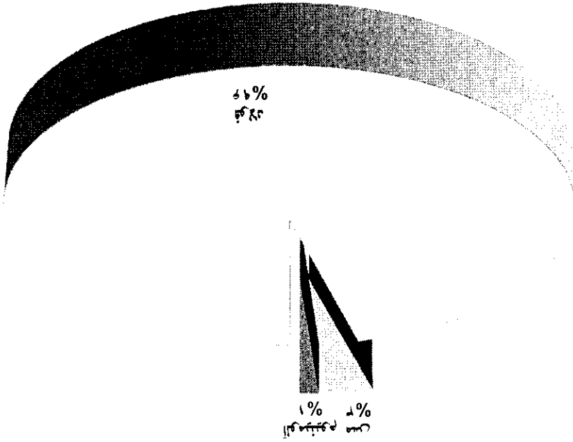
نمودار شمارنده ۸: توزیع نسبی مشکلات در میان جنسیت‌ها در سال ۱۳۹۵